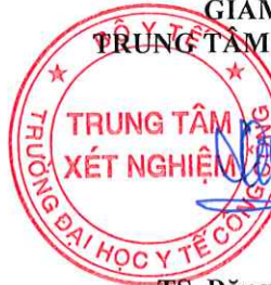
TS. Đặng Thế Hưng