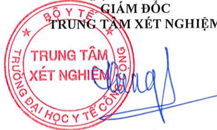
TS. Đặng Thế Hưng