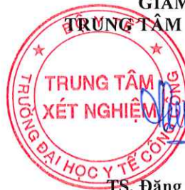
TS. Đặng Thế Hưng