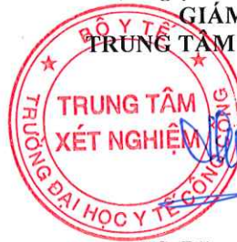
TS. Đặng Thế Hưng