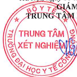
TS. Đặng Thế Hưng